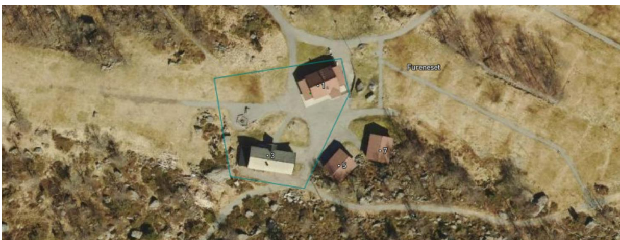
Figur 2: Kartutsnittet viser grensene for parsellen (festetomt) til Vesterlen, markert med blågrønn strek.

Furenesområdet, gnr. 51, bnr. 1 eies av Strand kommune. En parsell (festetomt) på 1840 m 2 er bortfestet til Vesterlen Speiderkrets av Norges speiderforbund (heretter omtalt som Vesterlen) (se figur 2 for eiendomsgrenser).