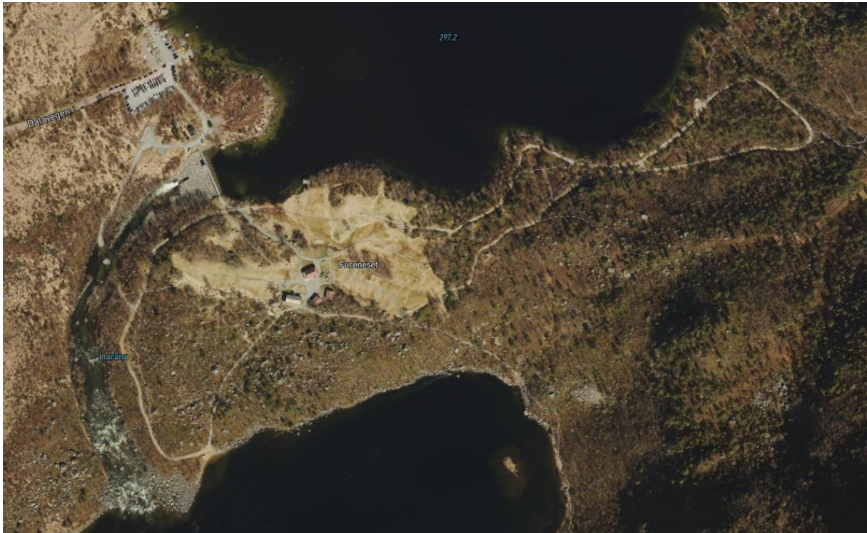
Figur 1: Flyfoto av Furenesområdet, med parkeringsplassen i nord, og speidertunet omkranset av leirplass og lysløype.

Furenesområdet ligger i enden av Dalavegen, og ligger fint til omkranset av fjell og turområder. Området har en mangfoldig natur, med stor variasjon i geologi, landskap, naturtyper og plante- og dyreliv. Furenesområdet er statlig sikret som friluftsområde, og er et viktig regionalt friluftsområde med en viktig funksjon som innfallsport til Jørpelandsheia.