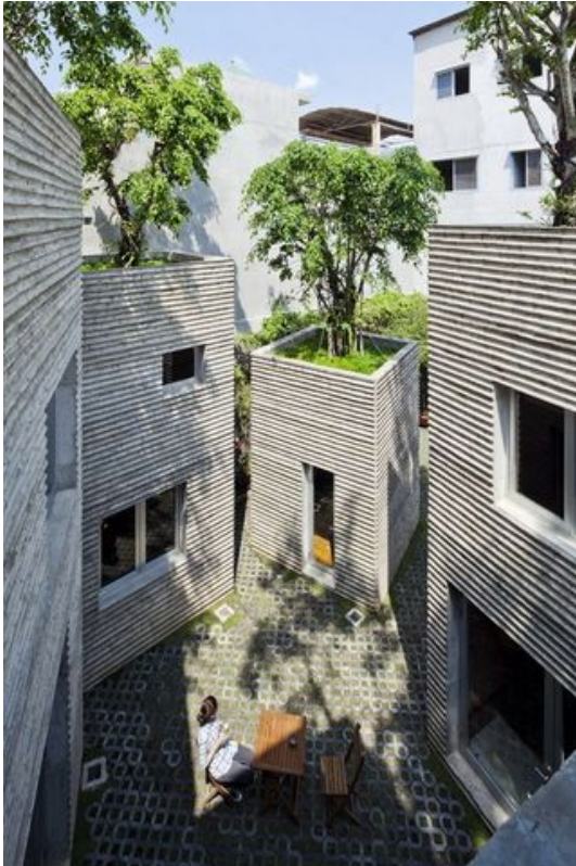
Vo Trong Nghia Architects ønsker å plante trær på takene av bolighus

Og legger til at det blir viktigere og viktigere å utvide takets funksjon på veien mot grønnere byer og smartere bygg.