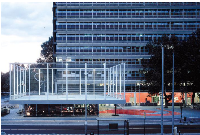
Her viser NL Architects hvordan taket kan benyttes til basketballbane.