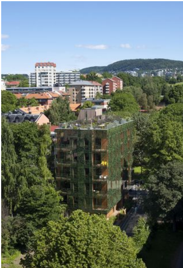
Elements arkitekter viser at taket og fasaden kan gjøre som til en grønn hage.

Av Mari Gisvold Solberg - Journalist i Teknisk ukeblad