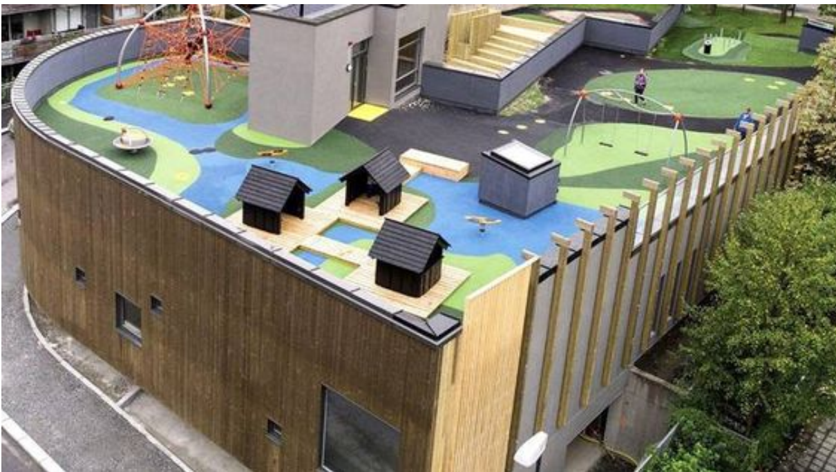
Linje arkitektur viser hvordan taket på et bygg kan benyttes til barnehage med uteplass. Linje Arkitektur

– Særlig i byer hvor det er trangt om plassen. Der tror jeg det vil komme krav om at alle nye bygg må ha noe grønt på taket, sier hun.